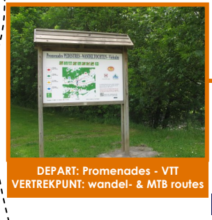
DEPART: Promenades - VTT VERTREKPUNT: wandel- & MTB routes